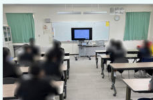
児童自立支援施設