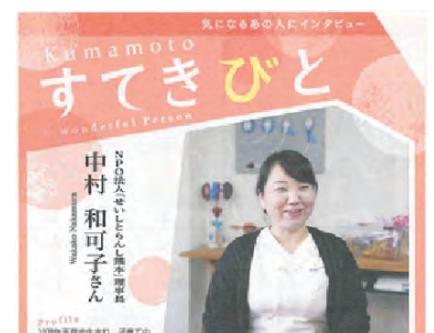
くまにち すばいす

「親子ですくすくサークルナビ」にて法人についての活動内容やインタビューが掲載されました。