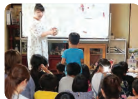
おうち食堂 竹ちゃんち