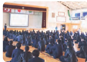
阿蘇中央高等学校