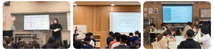
山鹿市鹿北小学校 熊本工業高校 (定時制) 児童養護施設 愛隣園

●提供先一覧 【小学校】七城小学校 / 北川福小学校 (佐賀県) / 七城小学校 / 津森小学校 / 山鹿市立鹿北小学校 / 八千把小学校 【中学校】益城町立益城中学校/砥用中学校/山鹿市鹿本中学校 / ルーテル学院中学校 【高校】熊本県立八代工業高等学校 (定時制)/熊本県立熊本農業高校/熊本県立 熊本工業高校(定時制)/熊本県立甲佐高等学校/熊本県立八代工業高等学校/熊本 県立天草高等学校 (全日制)/かもと稲田支援学校高等部 【大学・専門学校】学校法人滋慶学園 福岡ウェディング&ホテル・IR 専門学校 / 立命館大学みらいゼミ 【職員・保護者】七城小学校 / 画図小学校 / 月出小学校 PTA / 西合志東小学校 PTA / 健軍小学校 PTA / 津森小学校 / 熊本県養護協議会ケアワーカー部会 / 菊陽町養護教諭部会 / 児童養護施設 愛隣園 / 北合志保育園 / 男女共同参画セ ンターはあもにい 【その他・施設】ハンズハンズ / 縁側 moyai / よかボス「くまもとスタイル」 推進事業推進セミナー