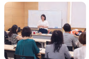
保護者向け性教育