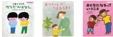
「性とからだの絵本」(堂心社)