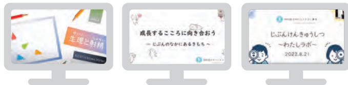
「月経と射精」 「自分のなかにあるきもち」 「じぶんけんきゅうしつ」

●テーマ一覧 【小学生対象】 「月経と射精」「自分のなかにあるきもち」「まわりの人のころろ」 「いのちのはじまり」「じぶんけんきゅうしつ」 「ぼく・わたし・おとも、ジェンダー初心者この指とまれ」 【中学生対象】「月経を知ろう、話そう」 【保護者対象】 「イマドキ中高生の SNS トラブル! 子どもたちの SOS に備えよう」 「家族ではじめる性教育 ①～③はじめてのいっぽ／おきがえ編／トイレ編」 スペシャルイベント:「こうのとりのゆりかご上映会」(親子参加) 【支援者対象】 「子どもたちの未来へ向けた性教育 ①～④基礎／幼児期／学童期／思春期」 オンラインスペシャル講演:「包括的性教育のはじめかた」:講師 遠見才希子氏 「新春スペシャル だれもがこころよい社会の実現に向けて」 【性教育講師養成】SPA 養成講座 SPT 養成講座 (第 10 - 12 期修了: 計 19 名 / 第 13・14 期受講中: 計 10 名)