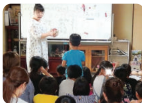
おうち食堂 竹ちゃんち