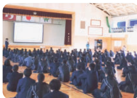
阿蘇中央高等学校