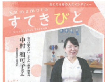
くまにち すばいす

「親子ですくすくサークルnavi」にて法人についての活動内容やインタビューが掲載されました。