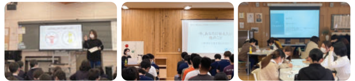
山鹿市鹿北小学校 熊本工業高校 (定時制) 児童養護施設 愛隣園

●提供先一覧 【小学校】七城小学校 / 北川福小学校 (佐賀県) / 七城小学校 / 津森小学校 / 山鹿市立鹿北小学校 / 八千把小学校 【中学校】益城町立益城中学校/砥用中学校/山鹿市鹿本中学校 / ルーテル学院中学校 【高校】熊本県立八代工業高等学校 (定時制)/熊本県立熊本農業高校/熊本県立 熊本工業高校(定時制)/熊本県立甲佐高等学校/熊本県立八代工業高等学校/熊本 県立天草高等学校 (全日制)/かもと稲田支援学校高等部 【大学・専門学校】学校法人滋慶学園 福岡ウェディング&ホテル・IR 専門学校 / 立命館大学みらいゼミ 【職員・保護者】七城小学校 / 画図小学校 / 月出小学校 PTA / 西合志東小学校 PTA / 健軍小学校 PTA / 津森小学校 / 熊本県養護協議会ケアワーカー部会 / 菊陽町養護教諭部会 / 児童養護施設 愛隣園 / 北合志保育園 / 男女共同参画セ ンターはあもにい 【その他・施設】ハンズハンズ / 縁側 moyai / よかボス「くまもとスタイル」 推進事業推進セミナー