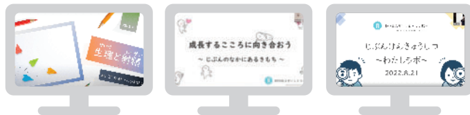
「月経と射精」 「自分のなかにあるきもち」 「じぶんけんきゅうしつ」

●テーマ一覧 【小学生対象】 「月経と射精」「自分のなかにあるきもち」「まわりの人のころろ」 「いのちのはじまり」「じぶんけんきゅうしつ」 「ぼく・わたし・おとも、ジェンダー初心者この指とまれ」 【中学生対象】「月経を知ろう、話そう」 【保護者対象】 「イマドキ中高生の SNS トラブル！子どもたちの SOS に備えよう」 「家族ではじめる性教育 ①～③はじめのいっぽ／おきがえ編／トイレ編」 スペシャルイベント：「こうのとりのゆりかご上映会」(親子参加) 【支援者対象】 「子どもたちの未来へ向けた性教育 ①～④基礎／幼児期／学童期／思春期」 オンラインスペシャル講演：「包括的性教育のはじめかた」：講師 遠見才希子氏 「新春スペシャル だれもがこころよい社会の実現に向けて」 【性教育講師養成】SPA 養成講座 SPT 養成講座 (第 10 - 12 期修了：計 19 名 / 第 13・14 期受講中：計 10 名)