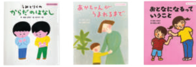
「性とからだの絵本」(堂心社)