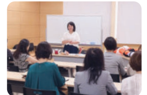
保護者向け性教育